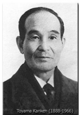
Toyama Kanken (1888-1966)